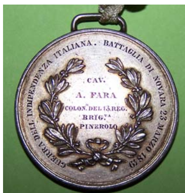
La medaglia del gen. Fara

Importante ricordare la riscoperta di un