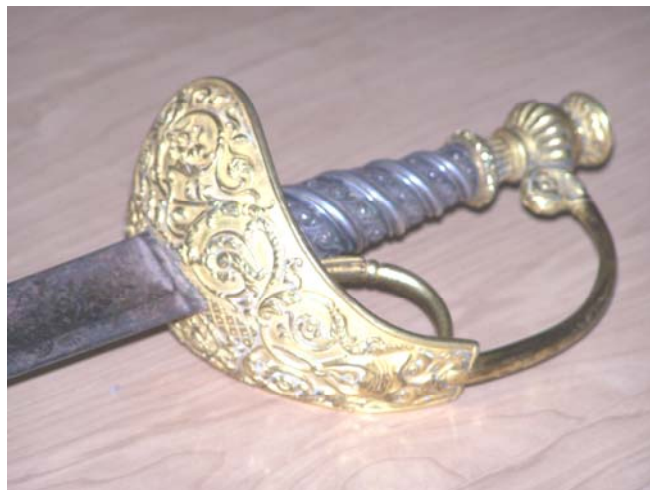
Particolare della spada

Merita inoltre segnalare che tra i beni della chiesa ci sono sia la spada che la medaglia che il gen. Agostino Fara aveva donato alla parrocchia. Il generale fu nominato dal re, commendatore dei Santi Maurizio e Lazzaro. La spada era stata offerta, nel